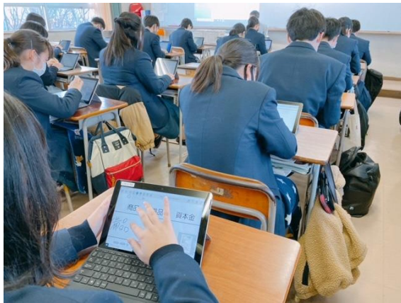
展開(画面上での解答)