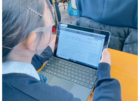
導入(個人端末で確認)