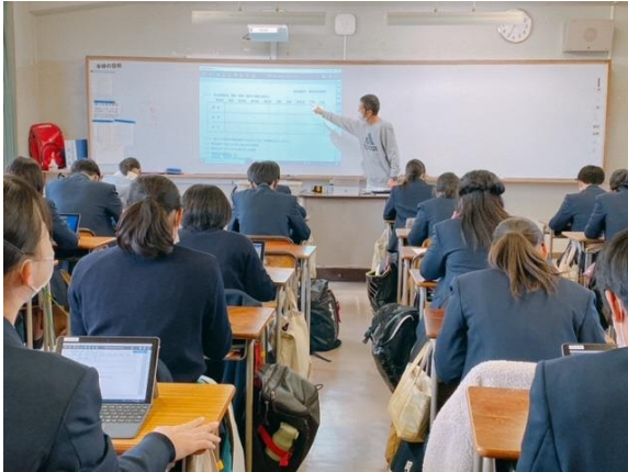
導入(生徒への説明)